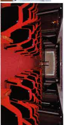
관서실 다신홀 디지털 자료실